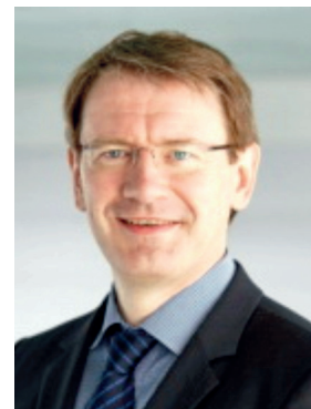
Професор Р. Сейл (Люксембург)

У подальшій роботі ми пропонуємо структурувати і розширити спектр наукових публікацій щодо заявленої теми журналу, друкувати звіти про міжнародні конференції з травматології та ортопедії, публікувати найцікавіші наукові повідомлення і доповіді, популяризувати успіхи і відкриття хірургів-практиків, ввести нові рубрики: огляди дисертацій, книг і статей, дискусії, колонки, інтерв'ю, думки та, звичайно ж, критику – “зворотний зв'язок” із читачами.