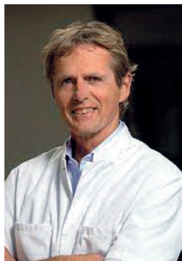
Професор К.Н. ван Дайк (Нідерланди)

Вітаю Вас з оновленням Редакційної колегії журналу “Вісник ортопедії, травматології та протезування”, особливо іноземних колег, які приєдналися до нас. Знакові професіонали, вчені, видатні хірурги України та багатьох країн світу погодилися брати участь у роботі нашого українського наукового видання. Серед них і Р. Сейл (Люксембург), В. Марчинський (Польща), К.Н. ван Дайк (Нідерланди), Д.А. Найланд (США), Ф. Нейрет (Франція).