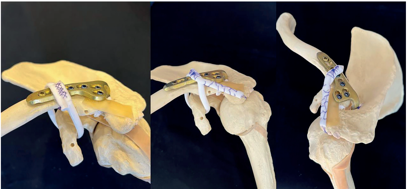
Рис. 1. Схематичне зображення динамічного типу фіксації вивиху акроміального кінця ключиці: а) пластика дзьобоподібно-ключичних зв'язок, вигляд спереду; б) пластика зв'язок акроміально-ключичного суглоба та дзьобоподібно-ключичних зв'язок, вигляд збоку; в) пластика зв'язок акроміально-ключичного суглоба та дзьобоподібно-ключичних зв'язок, вигляд спереду