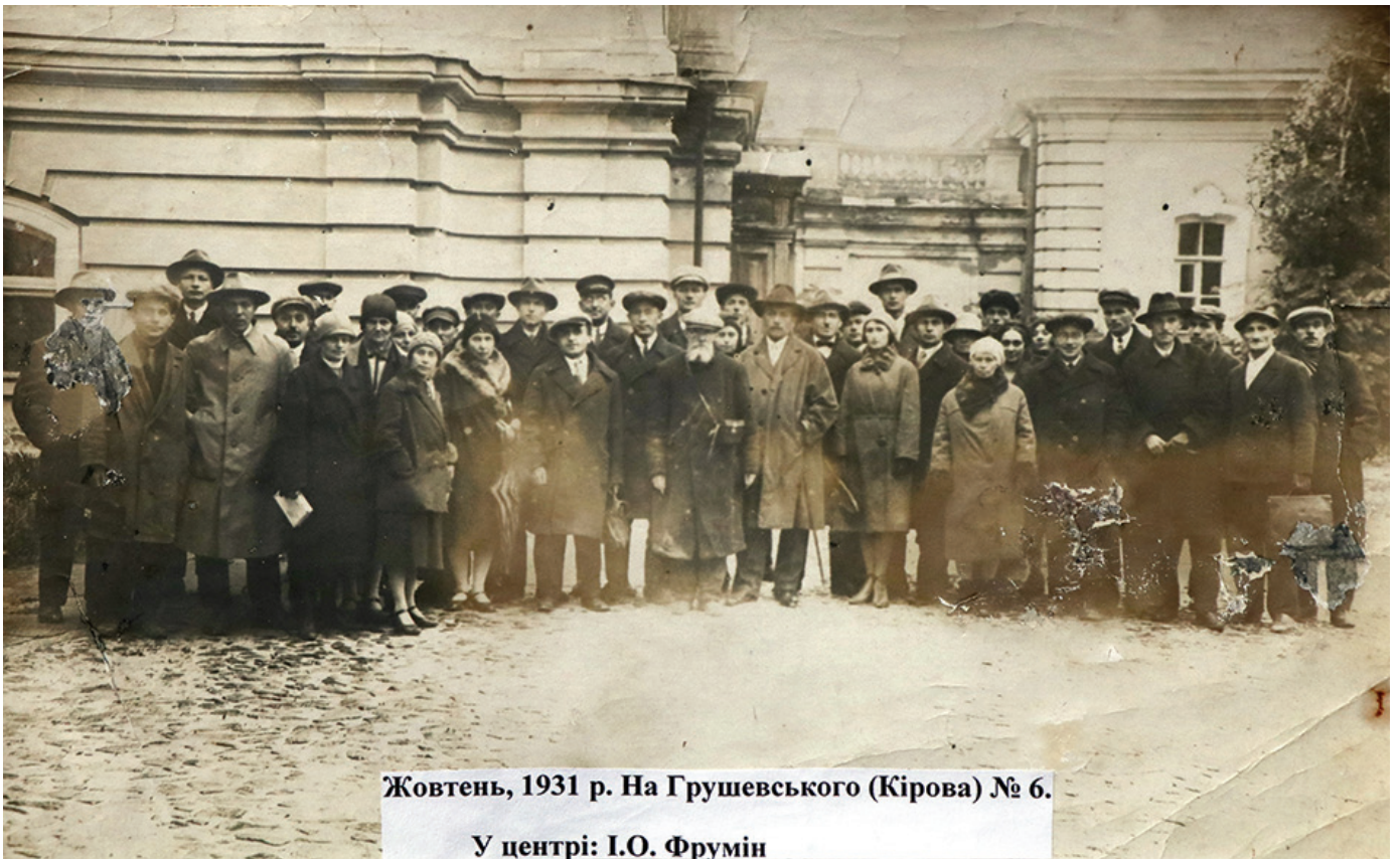
Жовтень, 1931 р. На Грушевського (Кірова) № 6.