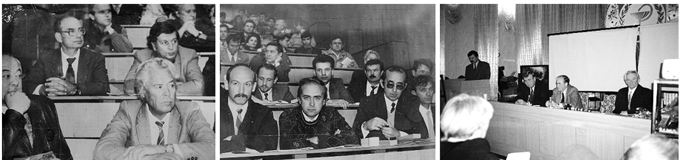
October 1985, first Ukrainian monothematical conference "Treatment of Hand Injuries and their Consequences"