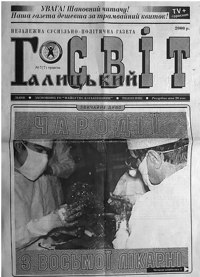
Newspaper Headline: Magicians from Eighth Hospital. About microsurgical limb replantation in Lviv

of polystructural upper extremity trauma, including gunshot wounds; surgical treatment of Dupuytren's contracture; treatment of tendinopathy; reconstructive interventions for upper extremity fractures and their consequences; treatment of congenital pathology of the hand; development of external fixation devices for hand fractures treatment; replantation of the upper extremity segments.